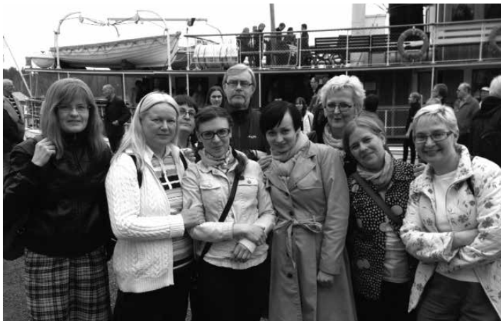
IHMO:n opettajia kevätrekellä Porvoossa.

Opettajiston edustaja Miika Snåre (Matilda Kärkkäinen)