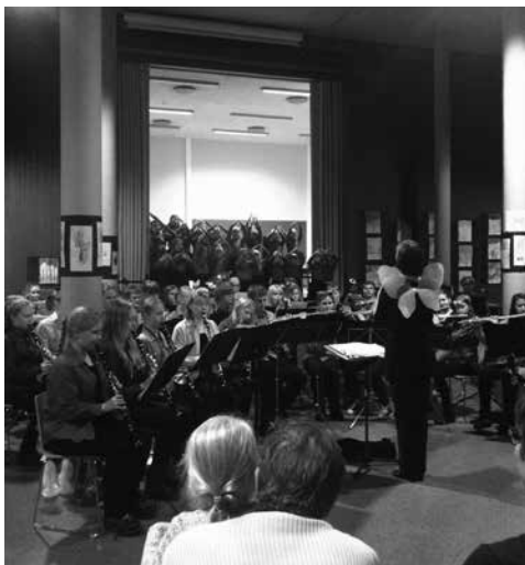
Tuuliviiorkesteri ja Itätuuli Eläinten tanssiaiset -konsertissa Sakarinmäen koululla. Mukana karnevaaleissa myös Lapsikuoro Sonetti.