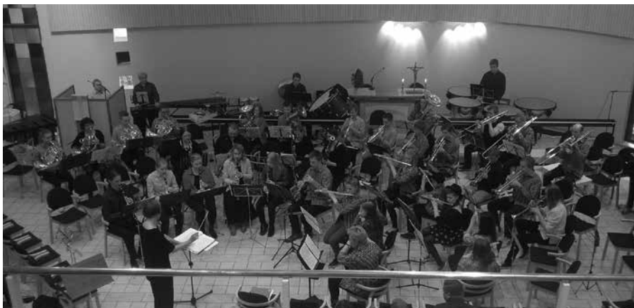
Kuva yllä: Itätuulen kevätkonsertti Myllypuron kirkossa.