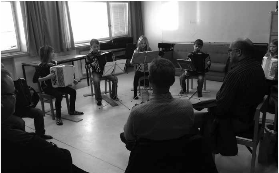
Tanskalaiset vieraat tutustumassa IHMU:ssa harmonikkaopetukseen.