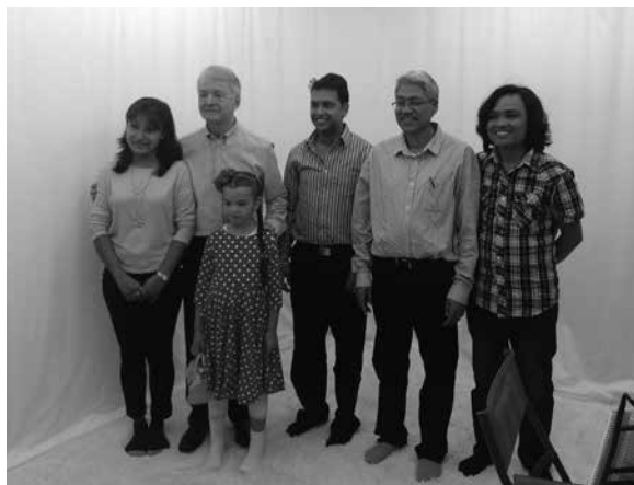
Nepalilaisia vierailijoita tutustumassa Colourstrings -etäopetukseen Laajasalon studiossa.