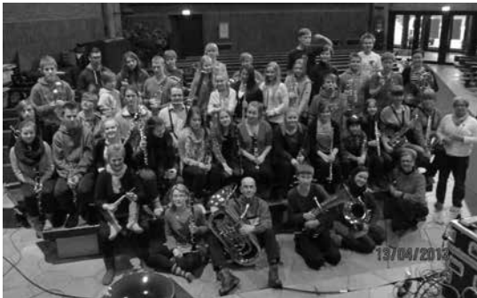
Puhallinorkesteri Itätuulen soittajat huhtikuisen äänityssession jälkeen Roihuvuoren kirkossa.