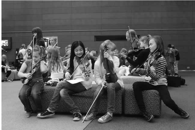
Viulisteja Musiikkitalon lämpiössä.