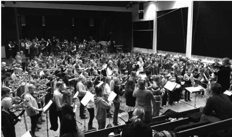
Yhteistyössä on voimaa: FiBO-orkesterin harjoitukset Porolahden peruskoulun juhlasalissa.